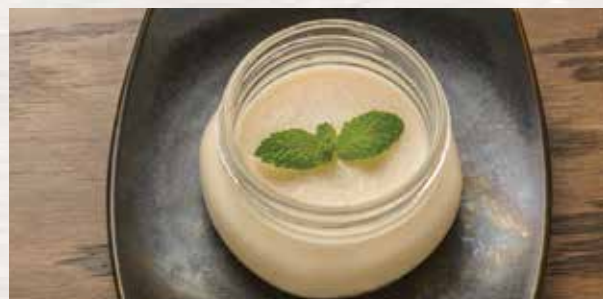
Coconut Milk Pudding $6 ココナッツミルクプリン