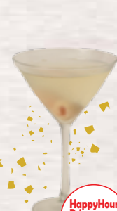
HappyHour Price $7 10 ライチ マティーニ LYCHEE MARTINI