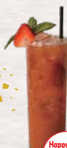
HappyHour Price $8 10 ストロベリー サンライズ STRAWBERRY SUNRISE