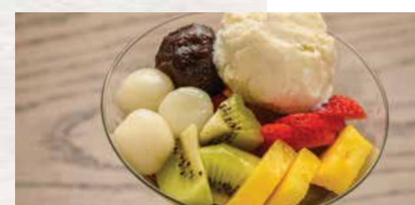
Anmitsu Parfait あんみつパフェ $12 Assorted fruits with gelatin, ice cream, mochi, and sweet red bean paste