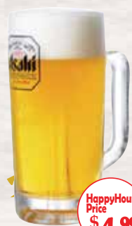
ASAHI アサヒ 7 DRAFT (生)

◆ 11:00 AM - 6:00 PM, 8:30 PM - CLOSING ◆ A FULL MENU IS AVAILABLE UPON REQUEST