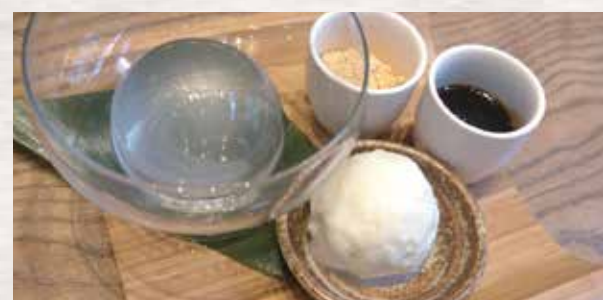
Water Cake 信玄餅 $7 Kuromitsu Syrup Kinako Powder Ice cream