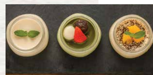
Pudding Sampler $15 プリンサンプラー