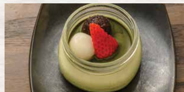
Green Tea Pudding $6 抹茶プリン