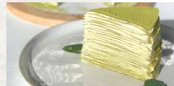
Green Tea Crepe Cake $12 抹茶ミルクレープ Twenty-five lacy thin layers of crepes enveloping the lightest pastry cream with vibrant green tea flavors. Locally made by "Room for Dessert".