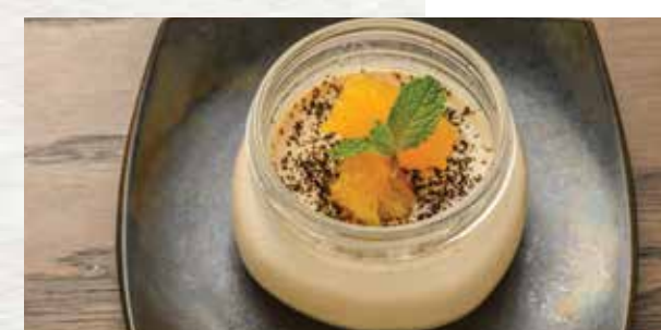
Earl Grey Pudding $6 アールグレイプリン