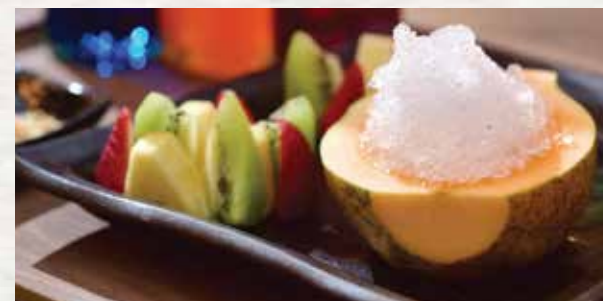
Shaved Ice Hawaiian Style $12 かき氷ハワイスไตล์ Shaved Ice in a Papaya Bowl, served with tropical fruits and your choice of syrup