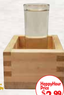
冷酒 7 COLD SAKE