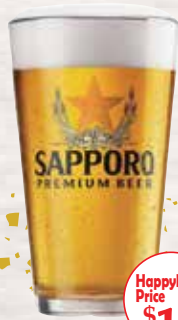
SAPPORO サッポロ 5 DRAFT (生)