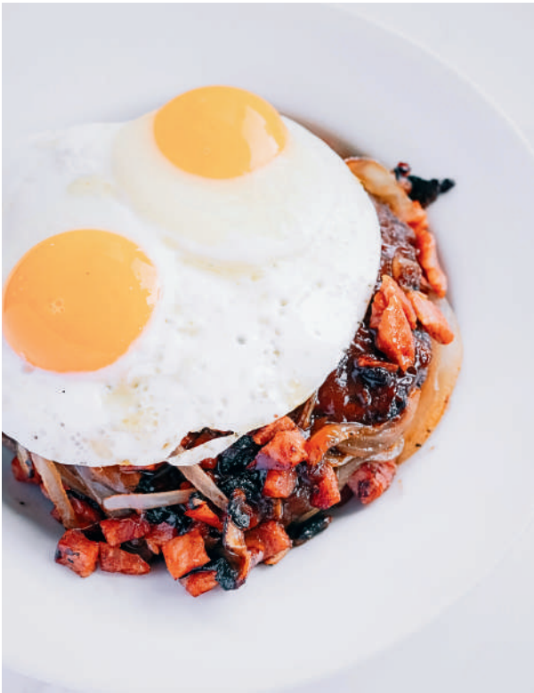
ハワイアンスタイル・ロコモコ