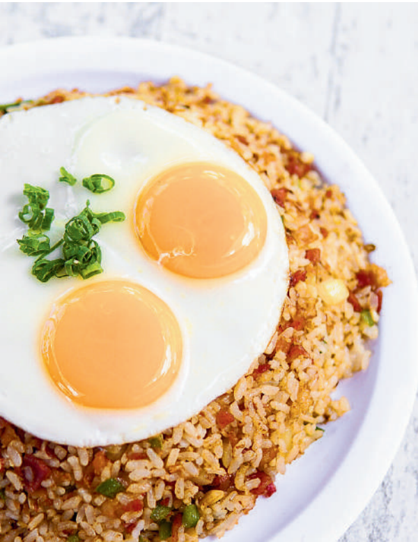
アイランドスタイル・フライドライス&エッグ