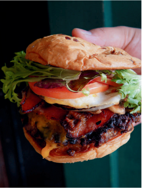
ENT シグネチャー チーズバーガー

本日のスペシャルクレープ $16.95 シェフ特製 本日のクレープをお楽しみください！