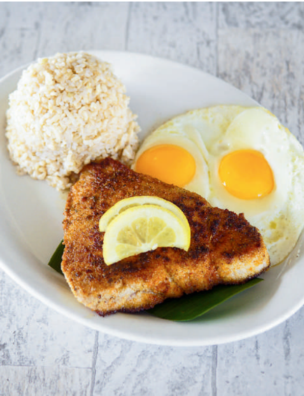
新鮮なハワイのアヒ（マグロ）、卵&白米添え