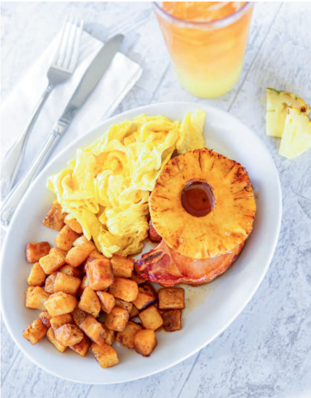
パイナップル・プランテーション ポークチョップ、卵&ポテト添え