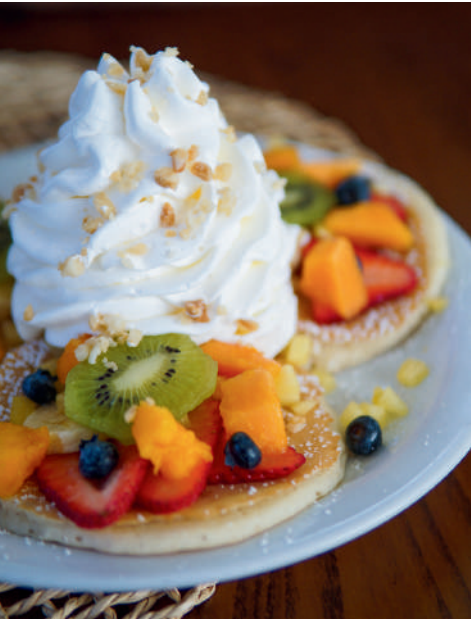
レインボーパンケーキ