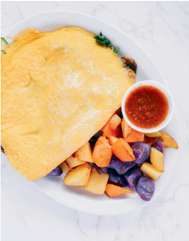
ベジタリアンオムレツとグレードアップした3色ポテト添え