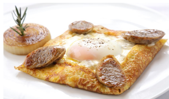
6) SALSICCIA CREPE* $12.95

STRAWBERRIES, BLACKBERRIES, BLUEBERRIES, RASPBERRIES, BANANA, WHIPPED CREAM