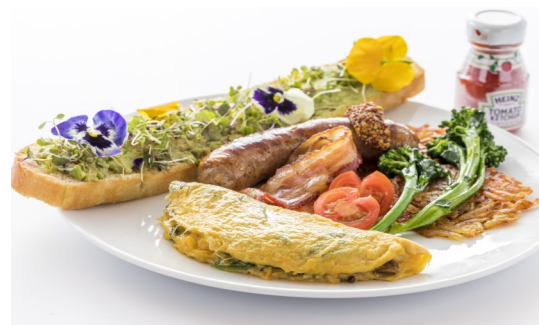
1) Breakfast Platter $13.95

FRITTATA (ITALIAN OMELET), ITALIAN SAUSAGE, BACON, CHERRY TOMATOES, BROCCOLINI, AVOCADO GARLIC TOAST, HASH BROWN POTATOES