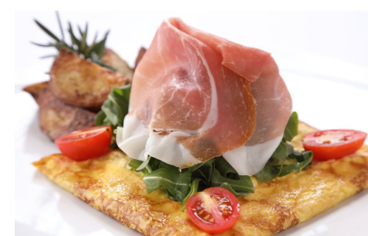
4) PROSCIUTTO E RUCOLA CREPE $13.95

BAKED IN OUR PIZZA OVEN, SERVED WITH LILIKOI SAUCE, MIXED BERRY SAUCE, EARL GREY SYRUP