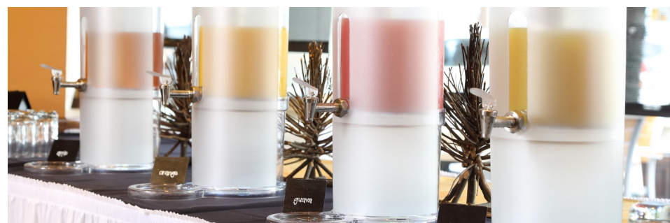
13) JUICE BAR $4.95 SELF SERVICE—UNLIMITED ASSORTED JUICES