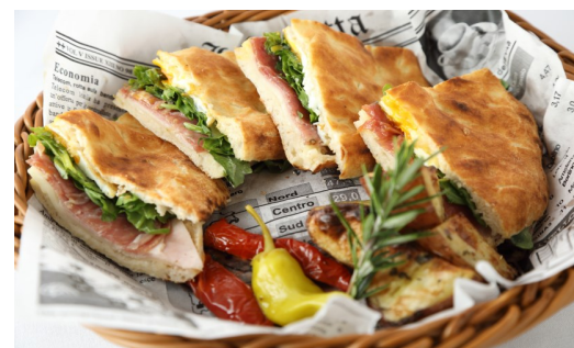
7) PANINO CON AFFETTATO E UOVA* $14.95

ITALIAN SAUSAGE, SOFT POACHED LOCAL WAIMANA TKG EGG, RED POTATOES, MOZZARELLA, ALFREDO SAUCE WITH ROASTED ONION