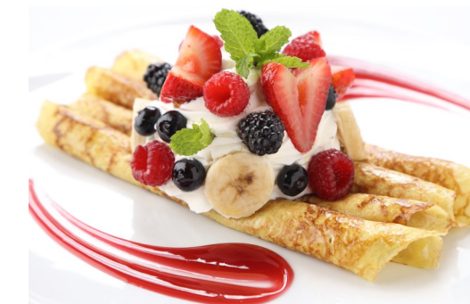
5) ミックスベリーのクレープ 生クリームをのせて $12.95