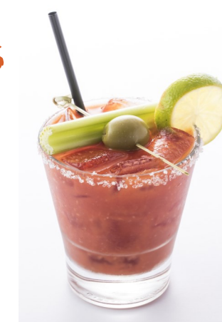
16) HIBISCUS SPUMANTE $5.95

*consuming raw or undercooked meats, poultry, seafood, shellfish, or eggs may increase your risk of foodborne illness.