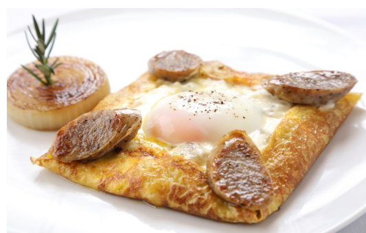
6) 一番人気！イタリアンソーセージクレープ 半熟玉子をくずして召し上がれ* $12.95