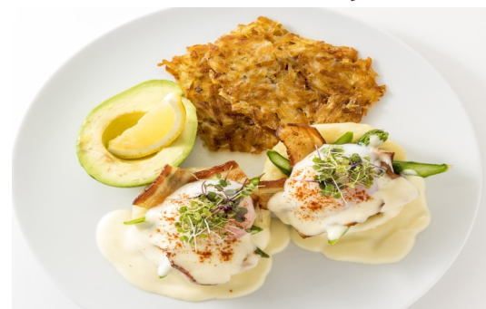
2) イタリアン・エッグベネディクト トロトロのアルフレッドソースがけ $14.95