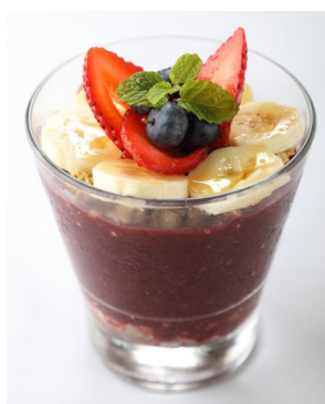
10) ちょっと食べたい フルーツアサイカップ $4.95