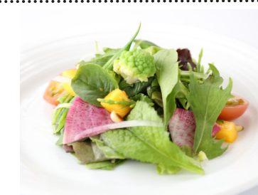
9) INSALATA MISTA $4.95 GARDEN SALAD