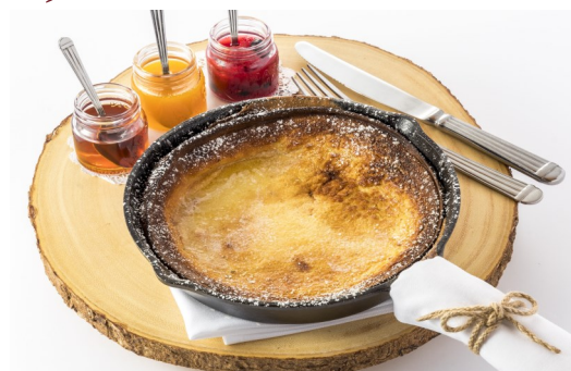
3) ピザ窯パンケーキ アールグレイ、ベリー、リリコイ、 3種類のソースでお楽しみください $11.95