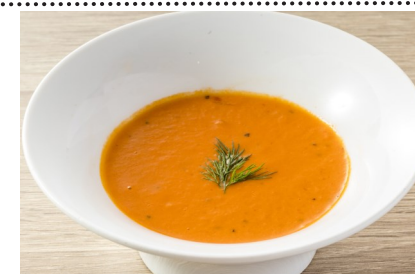
8) ZUPPA DI POMODORO $4.95 CLASSIC TOMATO AND BASIL BISQUE