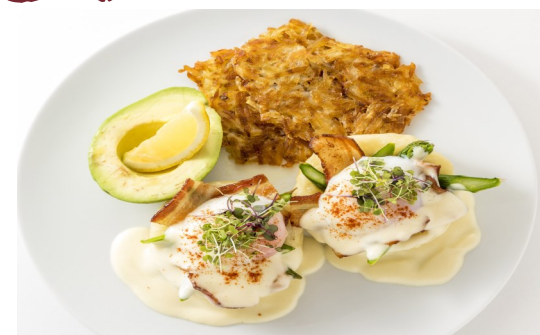
2) UOVO ALLA BENEDICT $14.95

FRITTATA (ITALIAN OMELET), ITALIAN SAUSAGE, BACON, CHERRY TOMATOES, BROCCOLINI, AVOCADO GARLIC TOAST, HASH BROWN POTATOES