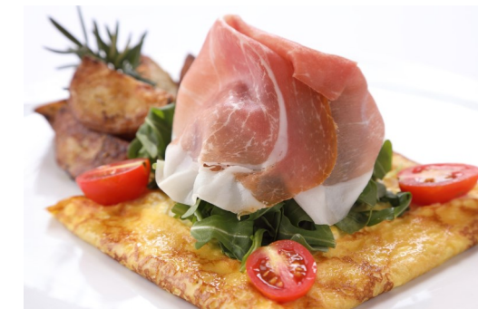
4) イタリアンクレープ ふんわり生ハムとチーズ $13.95