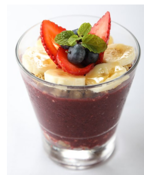
10) COPPA ACAI $4.95 ACAI WITH FRESH FRUIT AND GRANOLA