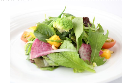
9) やっぱりバランスを考えてガーデンサラダでも？ $4.95